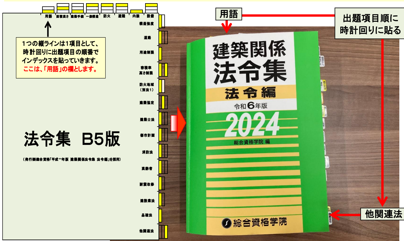
図1 法規の過去問20年の項目別一覧表

なお、研究会が採用している法令集は、(株)総合資格 令和5年版 建築関係法令集 法令編である。この法令集は、B5版と大きいことから研究会のタックの貼り方にマッチしていることと、1級建築士の出題問題に念頭に法文が絞り込まれており、1級建築士の試験に最も望ましい法令集である点にある。