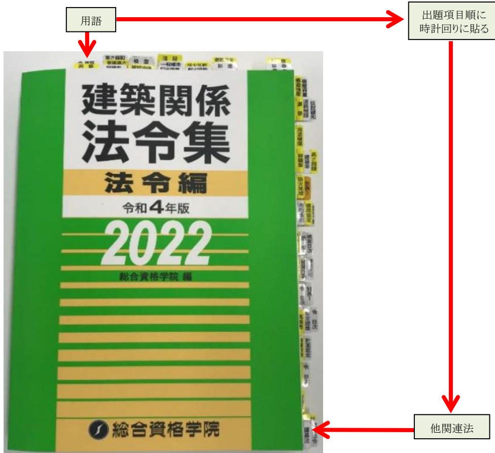
写真1 タックインデックスの貼り方の例