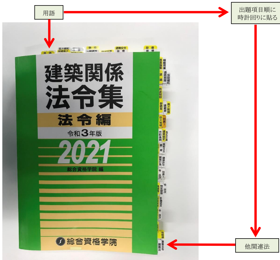
写真1 タックインデックスの貼り方の例