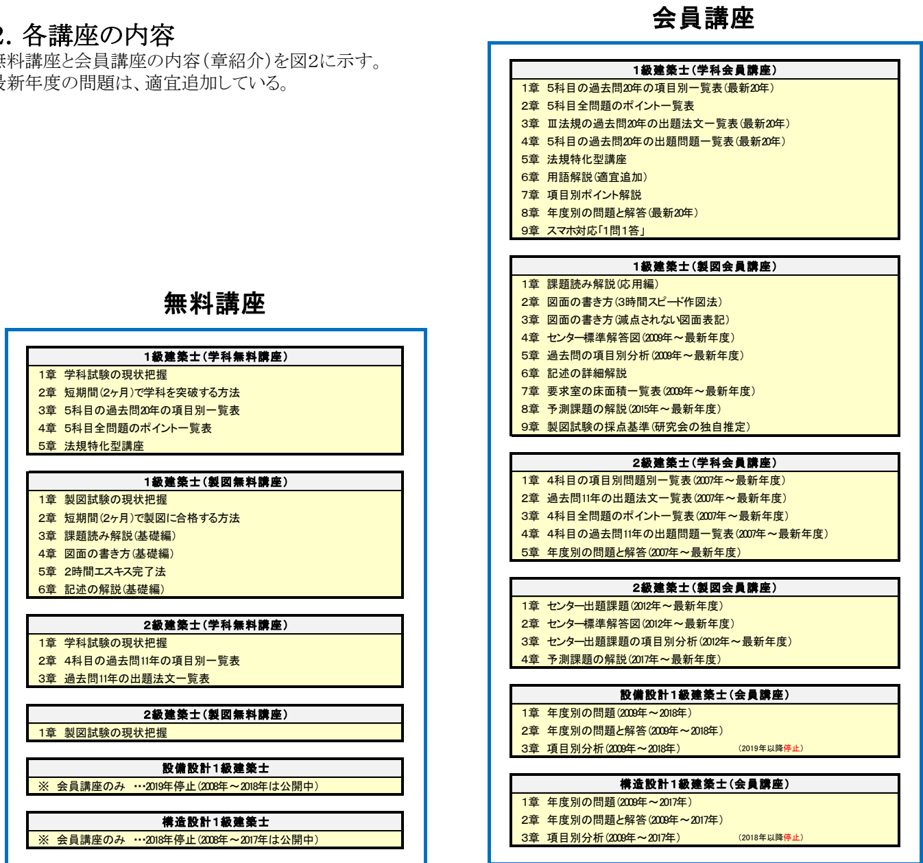
図2 無料講座と会員講座の内容(章紹介)

無料講座と会員講座の内容(章紹介)を図2に示す。最新年度の問題は、適宜追加している。