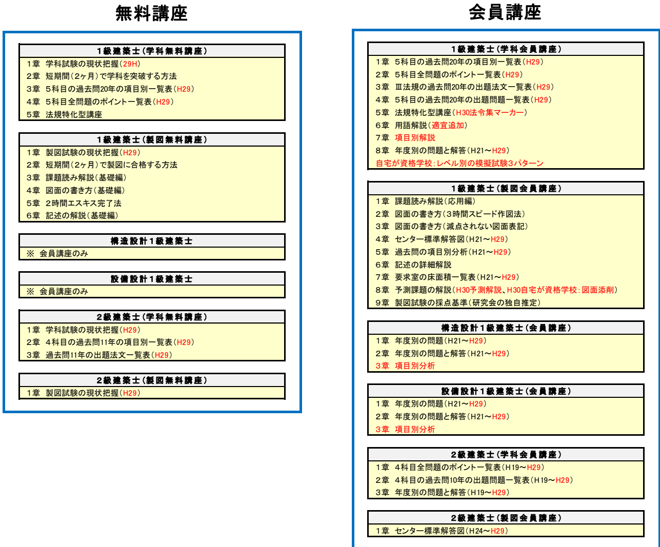
図2 2018年のアップ資料(赤字項目)

本講座は、「過去問」の把握が最重要であるとして、資料を取りまとめている。現段階では、1級建築士の講座が最も充実した内容であり、2017年からは、構造設計1級建築士、設備設計1級建築士、2級建築士の講座をアップした。2018年からは、HP容量を5倍に増設して、「自宅が資格学校」となるような内容を込め込んでいく。また、1級建築士の学科講座では、「項目別ポイント解説」の講座をアップする。これは、過去問だけの解説に止まらず、項目別の重要ポイントを図等を多く盛り込んで解説する。2018年アップ内容は、図2の赤字の通りである。